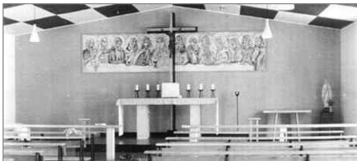
1967年頃の調布教会聖堂の外観と聖堂内